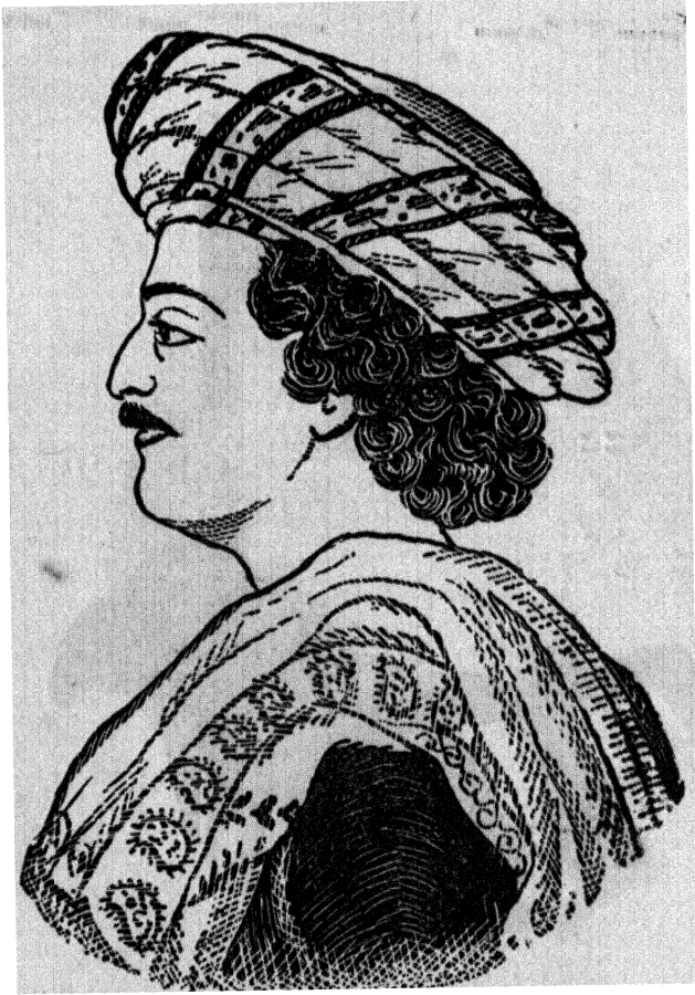
राजा राममोहन राय